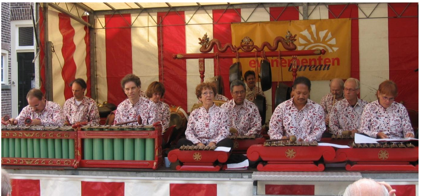
'Optreden Oosterse Markt'.